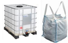
Poche IBC/ GRV (grand récipient vrac)