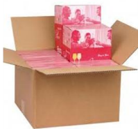
Carton de regroupement

(à l'exception des emballages de transport emballant des produits vendus par le biais de site de commerce en ligne s'adressant aux ménages).