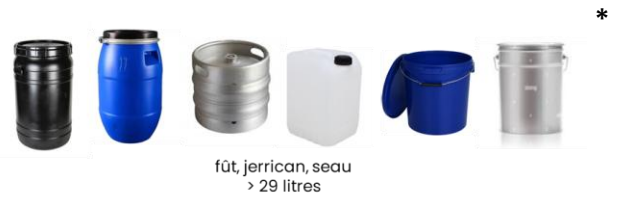
fût, jerrican, seau > 29 litres

(conçus spécifiquement pour usage en centre hospitalier, laboratoire et élevage professionnel).