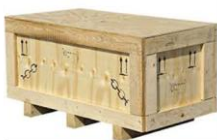
Caisse en bois sur mesure

(à l'exception des emballages permettant de regrouper et vendre en pack des produits emballés pouvant également être délottés au point de vente pour être vendus individuellement).